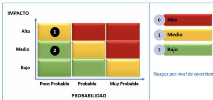
Figura 6: Mapa de Riesgo de PRODUCE